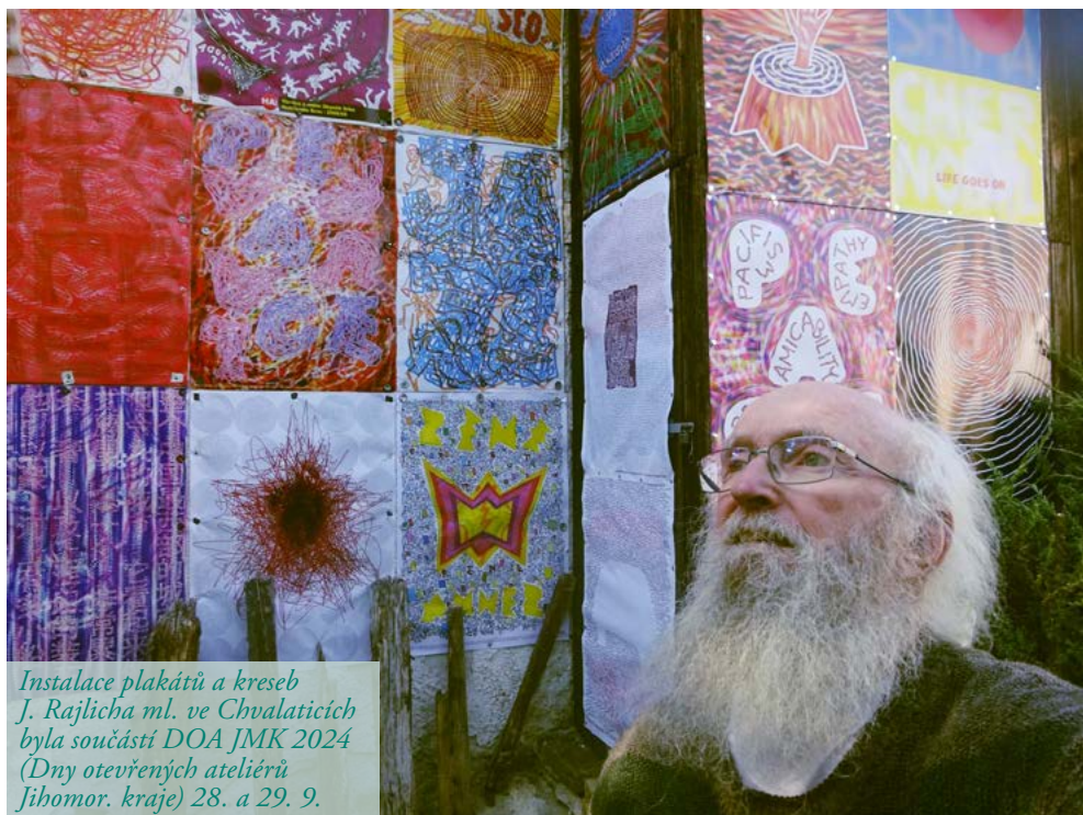
Instalace plakátů a kreseb J. Rajlichy ml. ve Chvalaticích byla součástí DOA JMK 2024 (Dny otevřených ateliérů Jihomor. kraje) 28. a 29. 9.